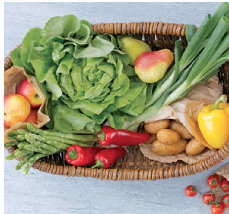
Frische, naturbelassene Lebensmittel sind die beste Wahl.

Diese Phase dauert »lebenslanglich«. Sie beginnt, sobald das Wunschgewicht erreicht ist. Die Teilnehmer sichern den erzielten Erfolg durch die Beachtung der acht Grundregeln und den Einbau regelmäßiger Bewegung in den Tagesablauf. In dieser Phase dürfen auch Lebensmittel gegessen werden, die nicht auf dem individuellen Plan stehen.