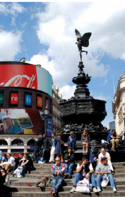
10110 Abb.: In

Am Nordende des Platzes führt die Wardour Street bis zur Gerrard Street, der Hauptachse des Londoner Chinatown 15, das man durch einen Torbogen betritt. Hier kann man fast überall