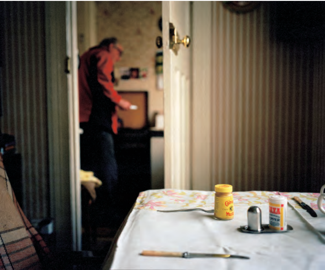
My Uncle's Home Donovan Wylie 1998