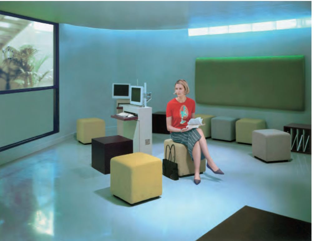
The Dentist Hannah Starkey 2003