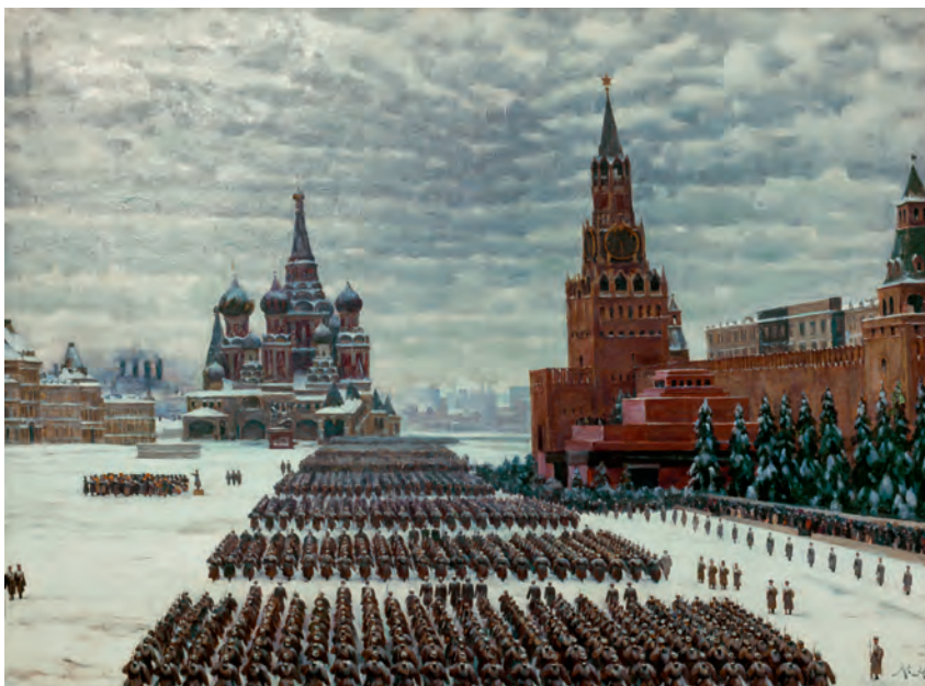
Die Rote Armee demonstriert auf dem Roten Platz in Moskau Stärke, doch noch war die stärkste Armee der Welt nur bedingt einsatzfähig. Konstantin F. Juon, Parade , 1941.

Gewaltige Veränderungen prägten das Land. Die Kollektivierung der Landwirtschaft in den 1930er Jahren trieb Millionen Bauern in die Städte und schuf so die Voraussetzungen für eine groß angelegte Industrialisierung. Es entstanden Industriekombinate, eine Schwerindustrie, Retortenstädte und gewaltige Energiekombinate und Stauseen. Die Volkswirtschaft war zwar noch wenig effizient und produzierte zu Lasten des Konsums, doch bildete sie die Grundlage dafür, dass die Sowjet-