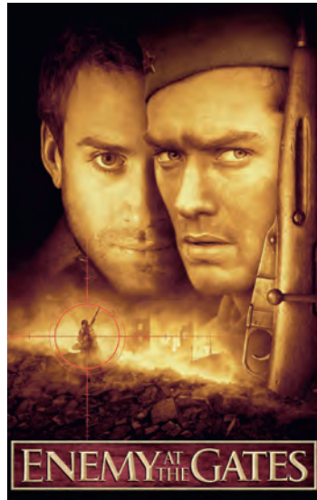
Plakat des Films Enemy at the Gates mit Jude Law und Joseph Fiennes aus dem Jahr 2001

Die Schlacht von Stalingrad war eine der grausamsten und blutigsten des Zweiten Weltkriegs. In der russischen Erinnerung lebt sie als heroischer Sieg über das »faschistische« Deutschland und als Wende im Zweiten Weltkrieg fort. Aber war dem wirklich so? War Stalingrad die Wende im Deutsch-Sowjetischen Krieg, hätte die Schlacht bei anderem operativem Verhalten der Wehrmacht gar gewonnen werden können? Das soll anhand der politischen Hintergründe, des Kriegsbilds und des Kräfteverhältnisses zwischen den Kontrahenten sowie des Kriegs- und