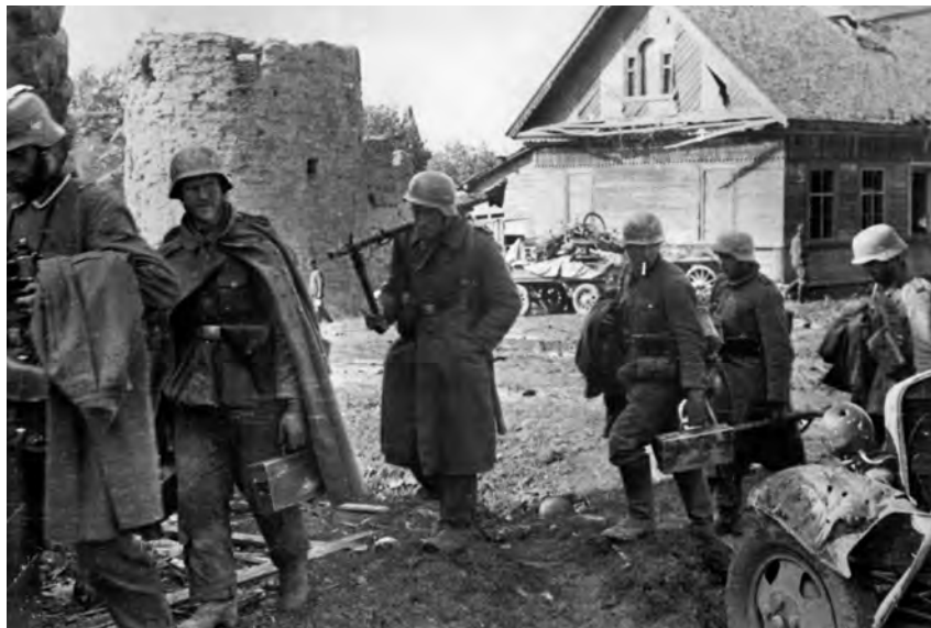
Infanterie der Wehrmacht in einer eroberten Ortschaft

schen Streitkräften hohe Verluste an Menschen und Material zu. In gut einer Woche drang die Wehrmacht bis zu 400 Kilometer ins Landesinnere vor. In der Kesselschlacht von Minsk und Białystok verlor die Rote Armee 420 000 Soldaten und über 3000 Panzer. Bei Smolensk betrug die Verluste 486 000, im Kessel von Uman 103 000, im Kessel von Kiew 665 000 Rotarmisten. Bis Ende 1941 gerieten rund 3,3 Millionen sowjetische Soldaten in Gefangenschaft. Die Rote Armee verlor über 12 000 Panzer und ebenso viele Flugzeuge. Am 3. Juli notierte Halder in sein Kriegstagebuch: