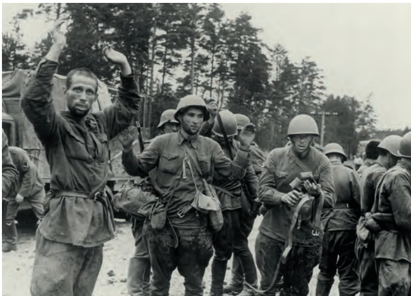
Die Grenzgarnisonen werden überrannt. Sowjetische Soldaten ergeben sich 1941.

Das Bild änderte sich jedoch bald. Die deutschen Truppen begannen, sich müde zu siegen. Oft gingen mehr Fahrzeuge durch Staub, der mit dem Beginn der regnerischen Jahreszeit zu Schlamm wurde, und fehlenden Nachschub verloren als durch Kampfhandlungen. Die Versor-