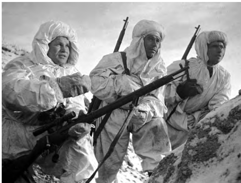
Wassilij Saizew bei der Ausbildung von Scharfschützen 1942