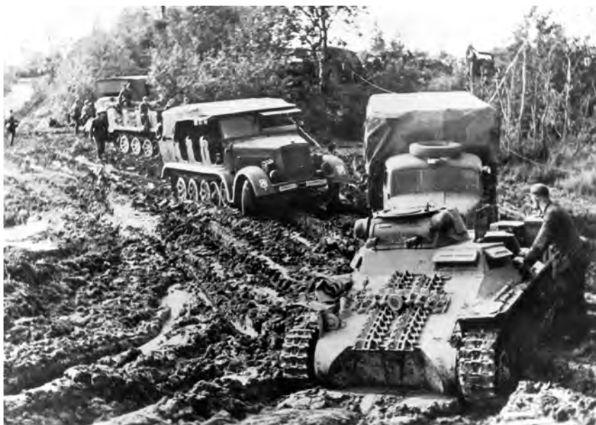
Erst Schlamm, dann Frost behindern den Vormarsch. Panzer I und Sonderkraftfahrzeuge 7 quälen sich auf einer unbefestigten Straße in den Weiten der Sowjetunion.

Anfangs schien es, als könne die Sowjetunion unmöglich derart gravierende Verluste an Mensch und Material kompensieren. Doch sie schöpfte aus ihren unendlich wirkenden menschlichen und wirtschaftlichen Ressourcen im Hinterland. Kein Plan der Wehrmachtführung hatte die etwa 12 Millionen Reservisten in der UdSSR einkalkuliert; auch das Wirtschaftspotenzial hinter dem Ural war unterschätzt worden. Obschon die UdSSR von Kriegsbeginn bis Ende 1941 nur etwa 6300 Panzer neu produzieren konnte, stieg die Produktionszahl konti-