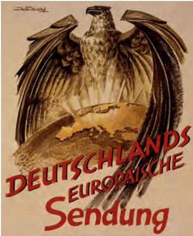
NS-Propagandaplakat aus dem Jahr 1941. Mit dem »Kreuzzug gegen den Bolschewismus« sollte Europa unter »die Flügel« des deutschen Adlers kommen.

herrschaft« und Bolschewismus identisch, die Russische Oktoberrevolution hielt er für ein Werk des »Judentums«.