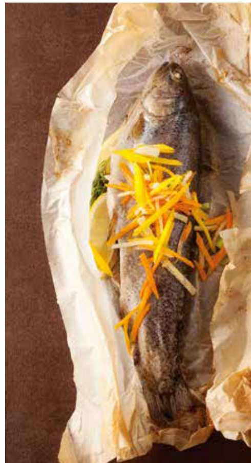
Hausbrot (Seite 29) Pramtaler Kürbiscremesuppe (Seite 49) Reinanken in der Pergamenthülle (Seite 126)