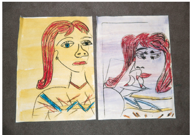
Schülerarbeiten „Picasso malt ein Porträt“