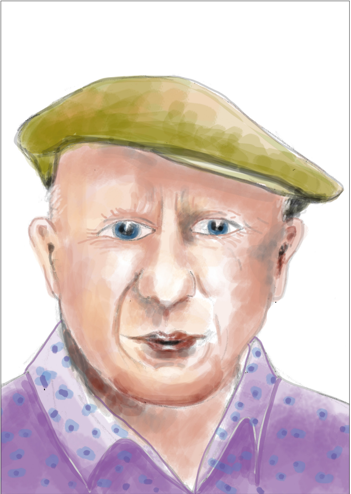
Pablo Picasso Illustration: Kristina Klotz