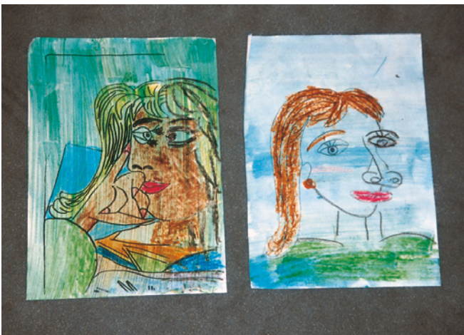
Schülerarbeiten „Picasso malt ein Porträt“

Die Schüler erhalten die Arbeitsvorlage (Kopie in DIN-A4- oder DIN-A3-Format). Wenn die Schüler das Porträt mit wasserfesten Wachsstiften fertigstellen, kann anschließend mit Wasserfarben ein heller Hintergrund hinzugefügt werden.