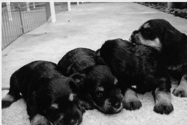
Angel und seine Wurfgeschwister

nem Teddy-Hundespielzeug und einer Hundebürste. Das ist die »persönliche Note«, die ein Verkauf bei einem Spitzenzüchter wie Brooke hat. Für sie ist ein Hund nicht nur ein Hund. Er ist zu 100 Prozent ein Familienmitglied, und obwohl sie es sich zur Lebensaufgabe gemacht hat, ein gutes Zuhause für ihre Tiere zu finden, nimmt jeder verkaufte Welpen ein kleines Stück ihres Herzens mit, wenn er sie verlässt.