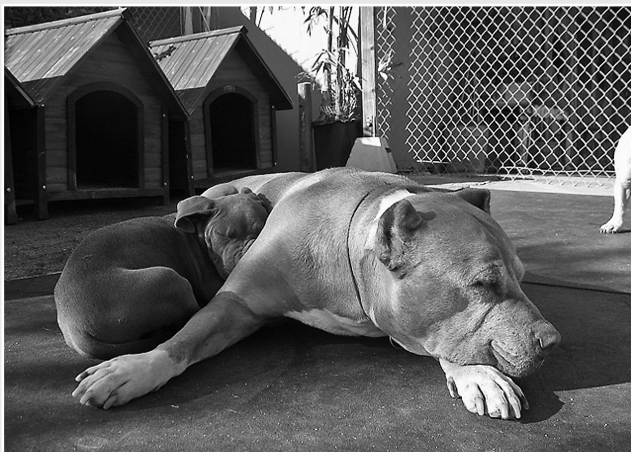
Daddy und sein Schützling Junior

Es ist mir sehr wichtig, einen Pitbull mit Vorbildfunktion zu haben, der mir bei der Rehabilitation aus dem Gleichgewicht geratener Tiere zur Seite steht. Meiner Ansicht nach ist es ein Verbrechen, was für einen schlechten Ruf diese Rasse genießt. Pitbulls sind zuallererst Hunde, keine wilden Tiere. Sie sind Haushunde, wie alle anderen auch. Natürlich sind sie nicht unbedingt für jede Familie geeignet – doch wenn wir der Rasse die Schuld an den vielen schrecklichen Vorfällen geben, von denen wir in der Zeitung lesen, vergessen wir dabei die grundlegende Tatsache, dass wir Menschen die Eigenschaften geschaffen haben, die wir bei ihnen missbilligen, um schlicht und einfach unsere Bedürfnisse zu erfüllen. Wir sind dafür verantwortlich. Im Laufe der Jahrhunderte haben wir diese Hunde genetisch so verändert, dass sie einen starken Kiefer, ein unerschöpfliches Durchhaltevermögen