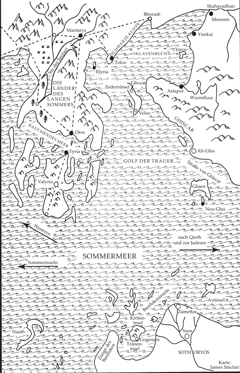
Karte: James Sinclair