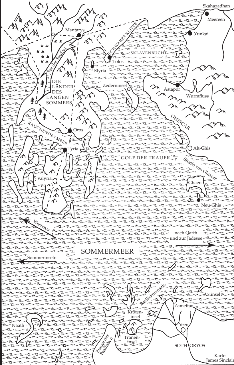
Karte: James Sinclair