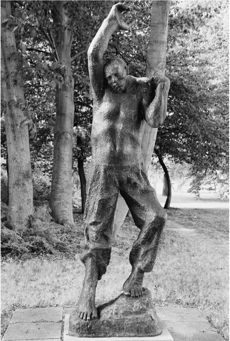
Fritz Cremer: Der Aufsteigende, 1966/67, Kunsthalle Rostock