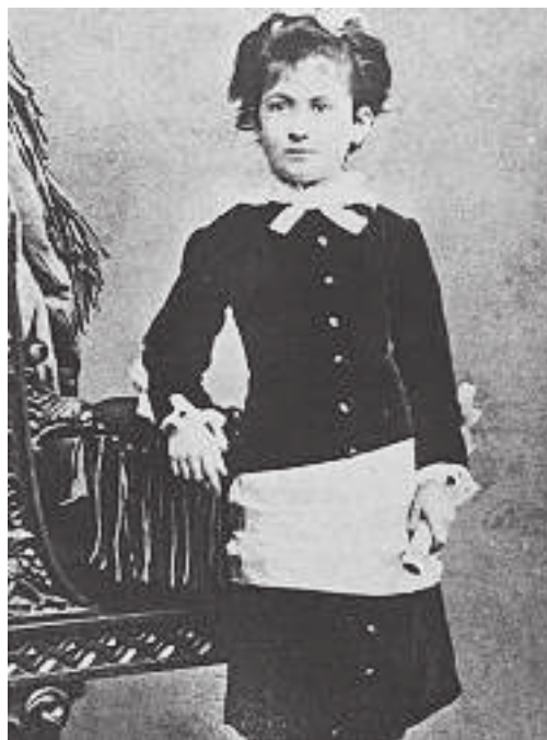
Maria Montessori 1880 im Alter von 10 Jahren

Es lässt sich vermuten: Montessoris spätere Kritik an Unterrichtsmethoden ist biographisch begründet und durch die Karriere ihrer Mutter beeinflusst. Montessori will etwas verändern an einem Bildungssystem, das starr und unbeweglich ist, autoritär und rigide. Mit anderen Worten: Sie hat die Vision einer Pädagogik entwickelt, die das einzelne Kind mit seinen Fähigkeiten ernst nimmt und entsprechend fördert.