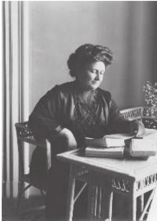
Maria Montessori 1913