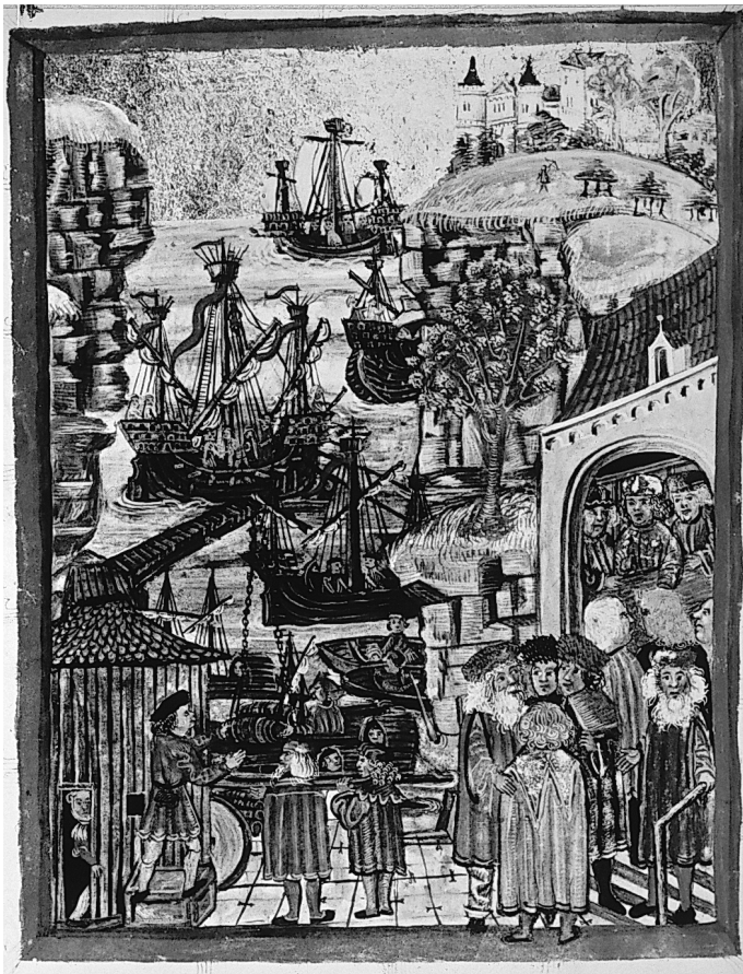
Die Hanse und ihre Schiffe: stolze Zeichen einer geschäftigen Kaufmannswelt.

Die Rätsel beginnen bereits mit der Frage: Was war die Hanse? Das Wort – Jakob Grimm hat es dem deutschen Germanistentag von 1847 in Lübeck handschriftlich bestätigt – kommt aus dem Gotischen und bedeutet Schar oder Gemeinschaft. Im Mittelalter meinte man damit Gemeinschaften von Kaufleuten. »Hanse« bezeichnet daneben die Abgabe, die man für die Zugehörigkeit zu einer solchen Gemeinschaft bezahlen mußte, oder auch deren gemeinsames Recht. So wird das Wort »Hanse« für viele »Hansen« verwendet; spezielle Aufschlüsse über das Wesen »der deutschen Hanse« ergeben sich jedoch nicht«