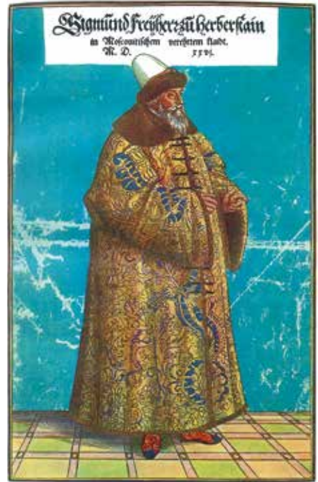
Sigmund von Herberstein

Im Jahre 1654 kam es nach einer langen Pause wieder zum Austausch von diplomatischen Missionen zwischen Wien und Moskau. Anlass war der Konflikt zwischen Polen-Litauen und dem Moskauer Staat. Die politische Lage nahm sehr schnell eine unerwartete Wende, als der schwedische König in Polen einfiel, den Konflikt verschärfte und Moskauer Truppen gegen die Schweden, die einen Großteil Polens erobert hatten, marschierten. Europa wurde in einen neuen großen Krieg gestürzt.