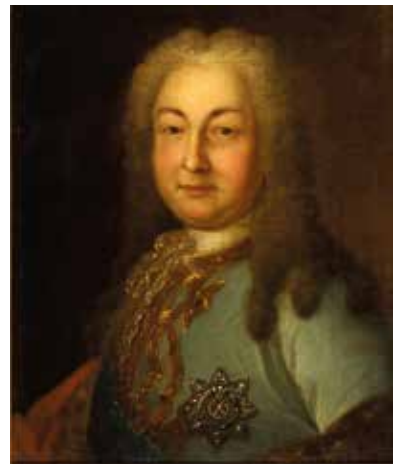
Portrait von A. I. Osterman. Unbekannter Künstler, 1730er-Jahre. Staatliches Historisches Museum Moskau.

Der russische Chefverhandler, Andrej Ivanovič Osterman (1668–1747), bezeichnete die im August 1726 geschaffene Allianz als „großes und nützliches Werk“ und „vorteilhafte Sache“ für beide Seiten und spielte damit auf die ihr zugrundeliegenden gemeinsamen Interessen an. Diese sah er vor allem in den die beiden Höfe einigenden Zielen in der Politik gegenüber dem Osmanischen Reich, Polen und Schweden. Darüber hinaus betrachtete Osterman die fehlenden Grenzen zwischen den verbündeten Reichen als notwendige Voraussetzung, um einander „alles Gute zu gönnen“.