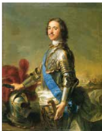
Portrait Peters I. Jean-Marc Nattier, 1717. Münchner Residenz.

Die Verhältnisse wurden zusätzlich auf eine Probe gestellt, als Peter der Große sich im Jahre 1721 den Titel Imperator zulegte. Preußen und die Vereinigten Niederlande akzeptierten die Neuerung ohne zu zögern. Österreich