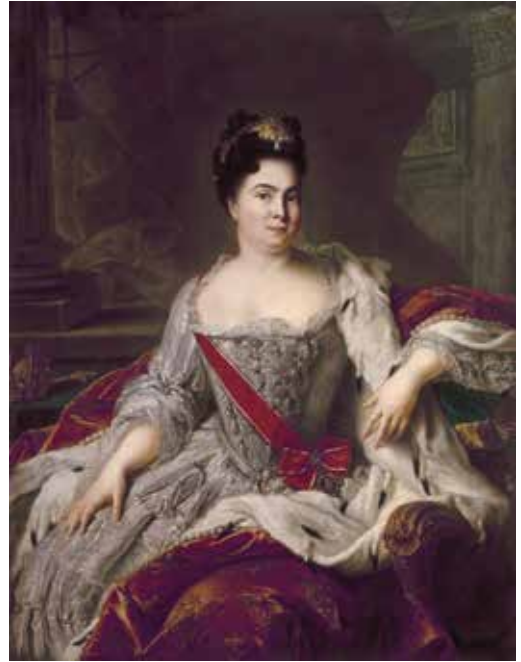
Portrait Katharinas I. Jean-Marc Nattier, 1717. Eremitage.

Die Krisen und Konflikte in Europa beeinflussten ebenso die Türkeipolitik der beiden Höfe, da diese zunächst durch ein gemeinsames diplomatisches Vorgehen in