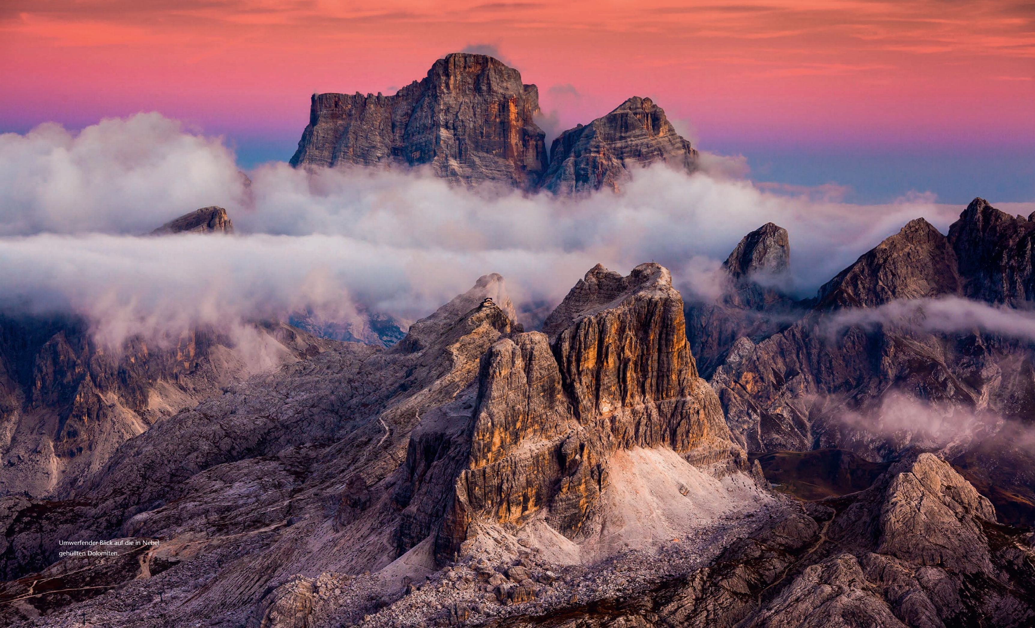
Umwerfender Blick auf die in Nebel gehüllten Dolomiten.