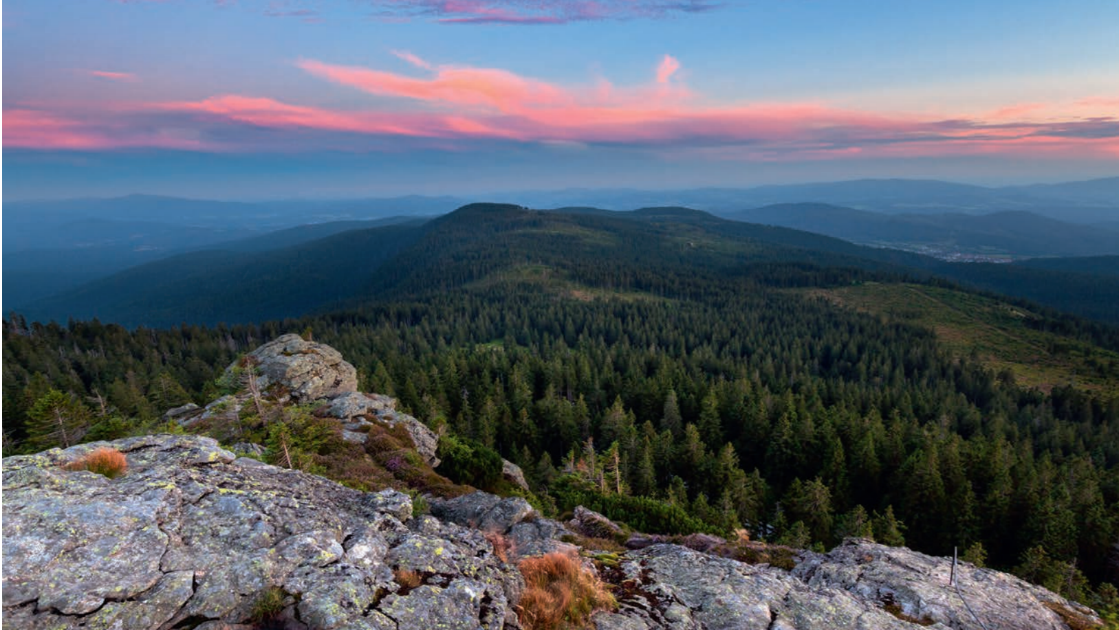
Sonnenuntergang am Großen Arber (oben). Der Luchs ist zurück auf leisen Pfoten (rechts).