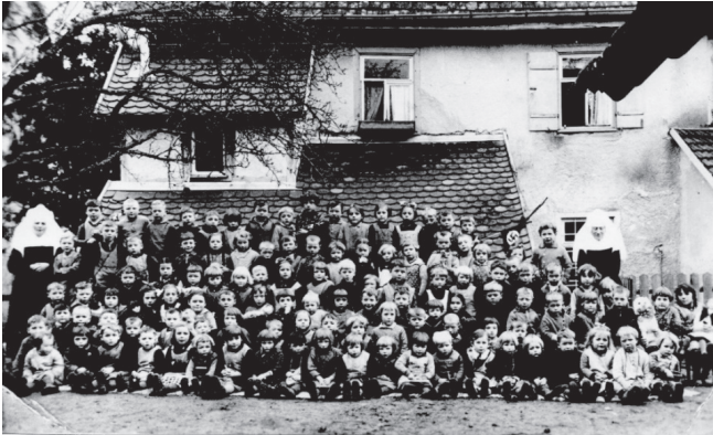
Die Hakenkreuzfahne (Pfeil) durfte nicht fehlen; Quelle: Ida-Seele-Archiv