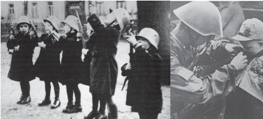
Altbewährte Wehrerziehung

missliebige Personen, insbesondere „jüdisch versippte“, aus dem öffentlichen Dienst zu entfernen. Das Gesetz gegen die Neubildung von Parteien vom 14. Juli 1933 verbot im Deutschen Reich alle Parteien neben der NSDAP. Wer die sogenannte Volksgemeinschaft als „nicht-arisch“ oder politisch unliebsam störte, wurde diskriminiert, verfolgt und sogar ermordet. Sofort begann man die „willensmäßige und geistige Einheit“ der deutschen Nation in Gang zu setzen. Bewusst und wohlüberlegt wurde diese Destination in erster Linie bei der Jugend zu erreichen gesucht, als den künftigen Trägern der neuen Volksgemeinschaft. Dazu gehörte auch die Kleinkindererziehung, deren „hohe Bedeutung... für die arteigene Volkserziehung und Durchblutung... der nationalsozialistische Staat“ (Kindergarten 1934, S. 196) erkannte.