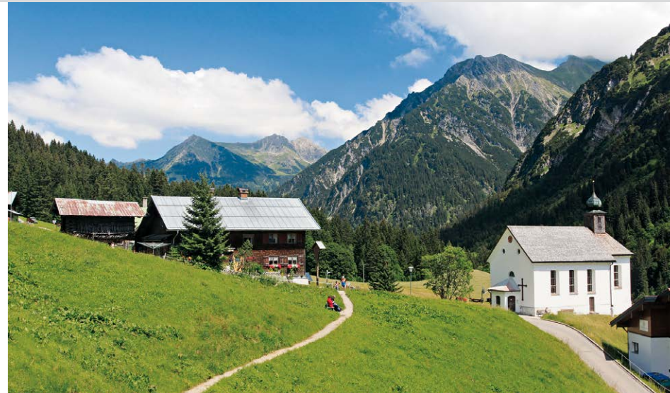
Der kleine Ort Baad im hinteren Kleinwalsertal.