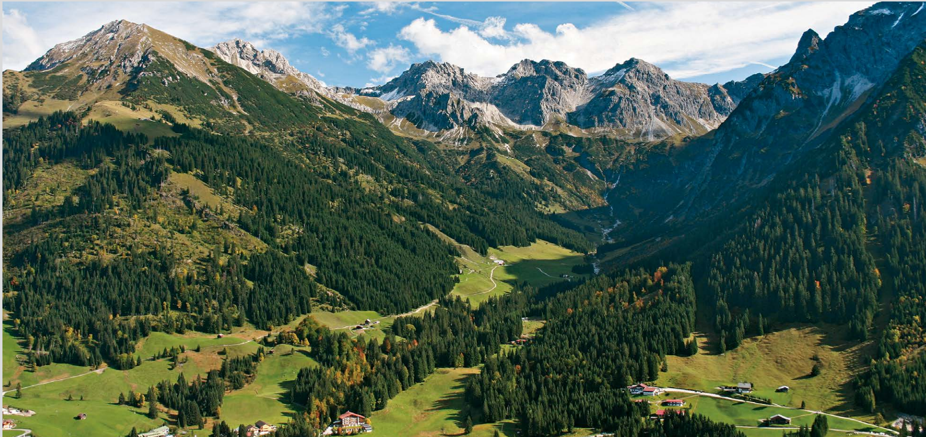
Ausblick vom Panoramaweg nach Südosten in den Talschluss des Wildentals