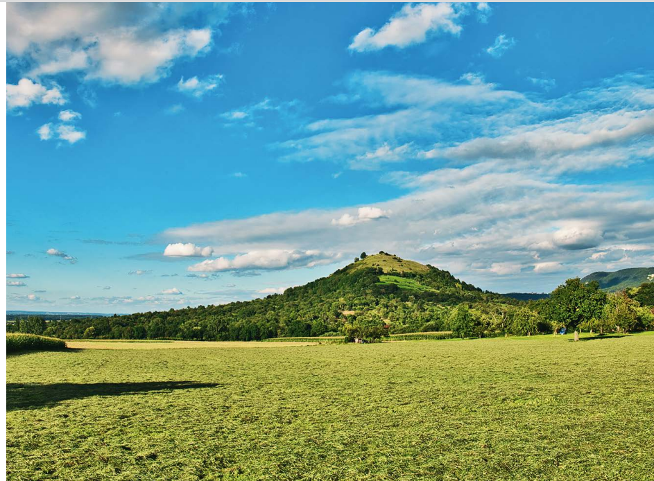
Die Limburg beim Rückweg nach Bissingen.

rechts ab. Wenig später erreichen wir die ersten Häuser von Bissingen und wandern geradeaus weiter bis zur Hauptstraße. Auf dieser gehen