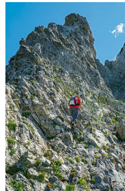
Eine durch Drahtseile gesicherte Felspassage im unteren Bereich des Fadenssteigs.

Hinweis: Im Abstieg kann bei Benützung des Salamanderlifts 45 Min. Gehzeit gespart werden.