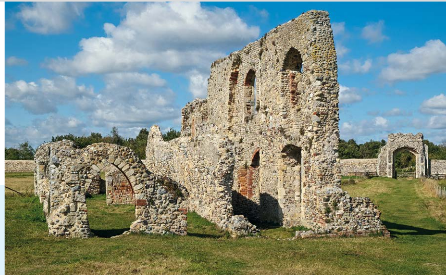
Die Ruinen von Dunwich Abbey liegen fast direkt am Weg.

Bridleway (8) nach rechts. Wir setzen unseren Weg nach Queren der Straße geradeaus fort und tauchen gegenüber in einen Wald ein. Wo ein Schild Fahrradfahrer (»Cyclists«) nach links schickt, setzen wir den Weg hinter einem Törrchen geradeaus fort. Der Weg mutiert zu einer Zufahrtsstraße, auf der wir die Westleton Road (9) erreichen; dort rechts. Wo sie links abknickt, wählen wir den Fahrweg geradeaus und wandern geradeaus hinunter zur Küste, wo wir links abbiegen und nach Kurzem die Ruinen der Franziskanerabtei Dunwich Abbey (10) links vor uns entdecken. Wir setzen unseren Weg rechts außerhalb der Mauern fort und erreichen Dunwich . Auf dem Sträßchen gelangen wir rechts zum Strand (11) . Dort kehren wir um, wählen bei der Straßengabelung die rechte Möglichkeit und passieren das Ship Inn und das kleine Museum. Bei einer Kreuzung bei der St. James Church (12) finden wir die Fortsetzung des Wegs als Feldweg auf der gegenüberliegenden Seite. Bald geht der Feldweg in einen Pfad über, auf dem wir die Sandy Lane Farm (rechts) passieren. Kurz dahinter erreichen wir eine Verzweigung (13) , wo wir den linken Weg nehmen. Nach einer Passage durch Wald gelangen wir über eine Wegkreuzung auf die Westleton Heath , wo wir die Richtung geradeaus auf einem Feldweg beibehalten, der auf eine Straße mündet. Wir begleiten sie auf einem parallel verlaufenden Pfad bis zu einer T-Kreuzung, biegen links ab und haben jenseits der Straße wieder den Ausgangspunkt (1) vor uns.