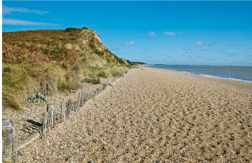
Dunwich Cliff und ein Kiesstrand begrenzen Dunwich Heath im Osten.

Von Seitenstreifen an der Minsmere Road (1) wandern wir in Fahrtrichtung weiter und nehmen die zweite Möglichkeit rechts (»Bridleway«). Wir queren die Mill Road , hinter der links ein Fußpfad (2) abzweigt, der geringfügig ansteigt. Bald durchmessen wir eine Senke, hinter der wir nach etwas Höhen Gewinn auf einen Feldweg stoßen. Diesem folgen wir nach rechts, bis er in ein Teersträßchen übergeht, auf dem wir Eastbridge erreichen. Bei der Gabelung im Dorf wählen wir die linke Möglichkeit und biegen hinter dem letzten Haus auf der linken Seite links auf einen Fußpfad (3) ab (FP-Hinweis beachten), der am Südrand der Minsmere Level entlangführt. Nach knapp 2 km schwenkt der Hauptweg nach halb links, während wir durch ein Tor geradeaus auf die Ruine der Leiston Abbey Chapel (4) zuhasten; dort links und auf dem Pfad rechts. Wir stoßen bald auf Minsmere Sluice , entern den Strandwall (5) und orientieren uns dort nach links. Unmittelbar vor den Minsmere Cliffs (6) biegen wir links ab, nach 20 m erneut links und anschließend rechts, um auf einem Pfad ins Binnenland zu