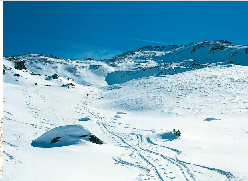
Weite Mulden zwischen Eiskarspitze und Torspitze (rechts).

Die Torspitze über der Wattener Lizum lässt sich trotz ihrer Höhe ohne allzu große Mühe auch im Winter besteigen, da vom Militärlager Walchen in die Lizum an Wochenenden ein Taxidienst besteht, der bei ausreichender Teilnehmerzahl auch während der Woche angefordert werden kann und zwei Gehstunden abnimmt. Wer sich die Lizumer Hütte für einen mehrtägigen Skitourenaufenthalt ausgewählt hat, kann die Torspitze an das Ende des Tourenprogramms legen und von dort zum Ausgangspunkt zurückkehren.