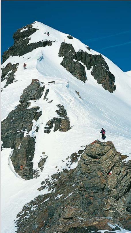
Steile Gratpassage zum Vorgipfel der Eiskarspitze (Variante).

(häufig unangenehme Passage). Dahinter senkt sich ein freier Hang zur Innermelangalm (1684 m) hinab. Hinter den Hütten müssen wir im leichten Linksbogen zu einem Wasserkraftwerk hinüberschieben. Hier mündet die Abfahrtsroute von der Wattener Lizum ein. Rechts des Lizumer Baches folgen wir einer Forststraße, die zuerst flach, dann steiler zu einer Almlichtung und zuletzt über Wiesen zum Bach hinabführt. Am rechten Ufer lassen wir es zum Lager Walchen hinauslaufen.