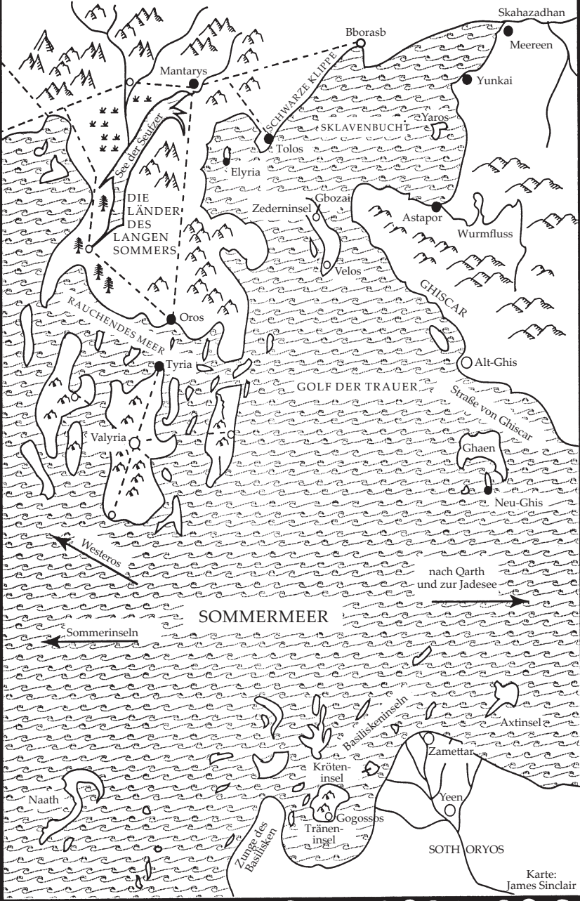
Karte: James Sinclair