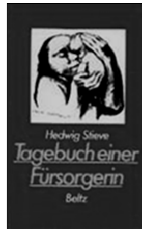
Abb. 1: Neuauflage des Tagebuches von 1983

Das Tagebuch von Hedwig Stieve beschreibt den Arbeitsalltag, die problematischen Arbeitsbedingungen des neuen Berufes und die eigene Betroffenheit gegenüber Not und Elend ihrer Schützlinge. Die Beschreibungen, aus denen nachfolgend einige wenige Auszüge wiedergegeben werden, beginnen zeitgleich mit der Wiederaufnahme ihrer Arbeitstätigkeit nach einer längeren Unterbrechung. Das Tagebuch selbst umfasst insgesamt rund 135 Seiten.