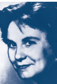
Harper Lee (1926–2016)