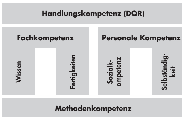
Abbildung 3: Kompetenzmodell des DQR (2011)

in diesem Sinne als Handlungskompetenz verstanden. Dazu differenziert der DQR neben den fachlichen die personalen Kompetenzen. Der Bereich der Methodenkompetenz wird hierbei, ebenso wie im KMK-Modell, als Querschnittskompetenz betrachtet (DQR, 2011, S. 5).