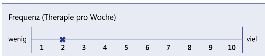
Abb. 1: Grafische Darstellung des Intensitätsfaktors Frequenz (nach Baker, 2012a)

Mit Ausnahme des ersten Faktors, der Therapieart, lassen sich alle anderen messen und in einer Skala wiedergeben, die von den beiden Endpunkten „wenig“ und „viel“ begrenzt wird (s. Abbildung 1).