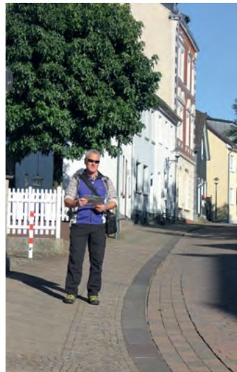
Auf dem Weg durch Wald

Die Kreuzung überqueren und wenige Meter danach links in die Pützgasse; hier beginnt die kleine Fußgängerzone, und keine 100 Meter weiter ist die Walder Kirche erreicht, einst Zentrum des alten Dorfes („Walder Rundling“). Im Kirchencafé im Anbau der Kirche