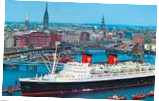
Hanseatic an der Hamburger Überseebrücke.

Da ab 1960 bereits die erste Boeing 707 der Lufthansa einen Nonstop-Flug in die neue Welt anbietet, endet die kurze Blüte des Transatlantik-Liniendienstes 1972 mit dem Verkauf der „Bremen“ nach Griechenland bzw. 1973 mit dem Konkurs der Hamburg-Atlantik Linie.