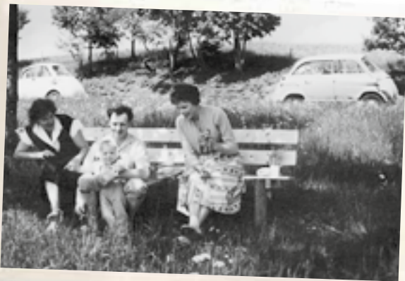
Zwischen BMW Isetta (links) und BMW 600 (rechts) auf Papas Schoß.

Wir fühlen uns wohl zwischen unseren Eltern auf der (einzigen) Sitzbank, auf welche man durch die große Fronttüre kommt. Bei schönem Wetter sorgt das aufklappbare Faltdach für frische Luft. Dennoch träumen unsere Väter bereits von einem größeren Auto. Einen Zwischenschritt stellt dabei der BMW 600 dar, dessen Fronttür durch eine (!) hintere Tür rechts ergänzt wird und eine zusätzliche Rücksitzbank bietet.