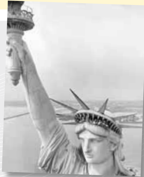
Die Freiheitsstatue in New York in den 50er-Jahren – ein Sehnsuchtsort für Touristen und Auswanderer.

In der zweiten Hälfte der 1950er-Jahre erlebt Deutschland nochmals eine größere Auswanderungswelle. Ein hoher Dollarkurs und die Chance zu schnellem