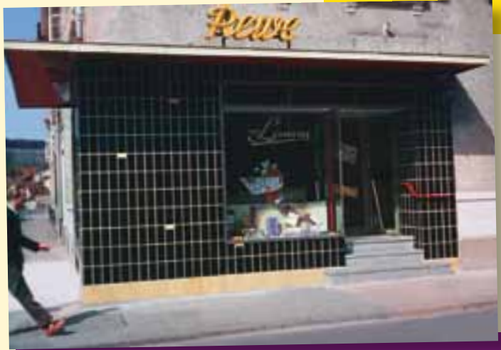
Der Kaufmannsladen an der Ecke.

kühltruhen mit „Jopa“-Eis am Stiel. Als etwas ganz Besonderes empfinden unsere Eltern die ebenfalls neu angebotenen tiefgekühlten Hähnchen – ein noch wenige Jahre zuvor kaum vorstellbarer Luxus. Neu sind Ende der 50er-Jahre auch Fassaden mit schwarzen Klinkern, welche mit einzelnen gelben Steinen elegant akzentuiert werden.