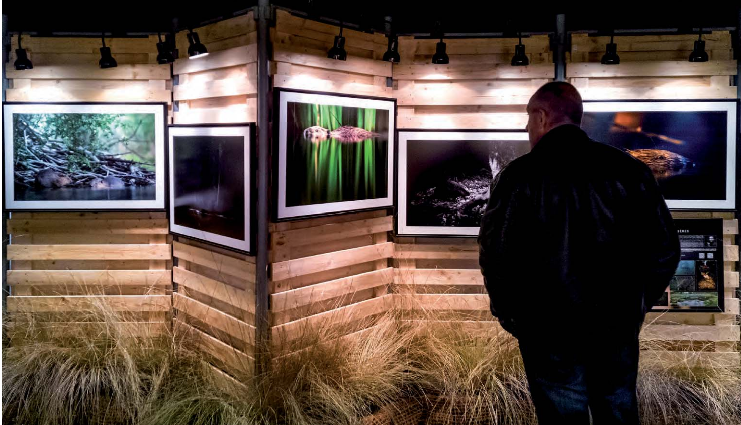
▲ Ausstellungen, Messen und Tagungen sind wertvolle Inspirationsquellen.

tens die Hälfte der Herbstwaldaufnahmen der niederländischen Fotografen scheinen aus dem malerischen Waldgebiet Speulder- en Spriederbos zu stammen. Es sind wirklich hinreißende Motive, aber es gibt doch noch so viele andere Wälder. Oder was halten Sie von der Rothirschbrunft im Bereich Wildbaan im Nationalpark De Hoge Veluwe? Auch daran ist natürlich nichts auszusetzen, aber versuchen Sie, dem Thema Ihre persönliche Note zu verleihen. Wie klischeehaft die Locations auch sein mögen, es ist sicherlich möglich, mit einem unvergleichlich starken Bild nach Hause zu gehen!