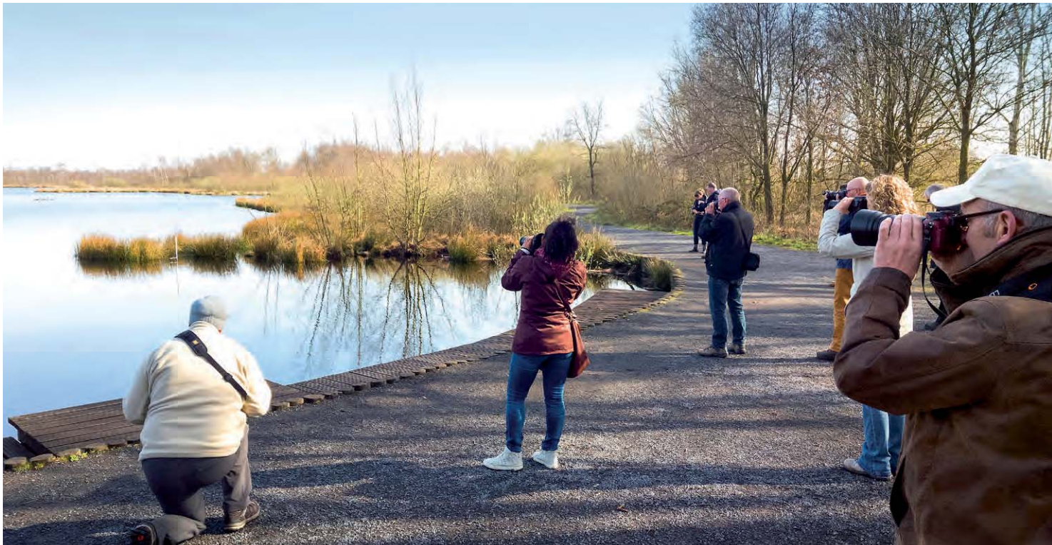
▲ Neue Kenntnisse und Inspirationen bei einem Workshop gewinnen.

Die Gefahr, in diese Falle zu tappen, ist groß, denn wir sind einer kontinuierlichen Reizüberflutung durch fantastische Aufnahmen ausgesetzt, die uns manchmal vor Neid erblassen lassen. Schauen Sie sich mal gründlich bei Facebook oder anderen Plattformen um, die viele Fotos zeigen. Wie viele eigene »einzigartige« Fotos können Sie ausmachen? Nehmen Sie beispielsweise den Herbst. Mindest-