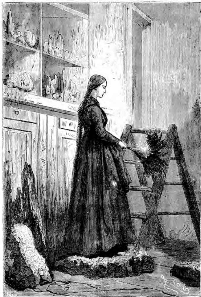
Gretchen war ein reizendes blondes Mädchen mit blauen Augen