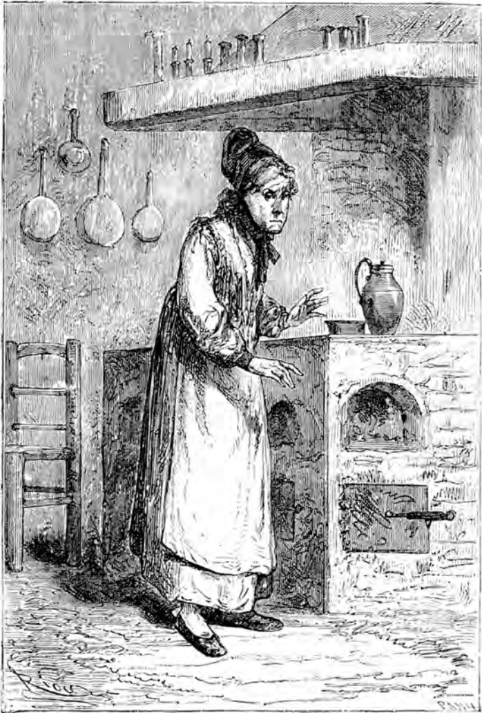
Mit Seufzen begab sich die alte Dienerin in ihre Küche zurück