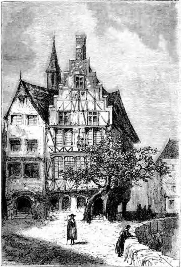
Er wohnte auf der Königsstraße in einem eigenen kleinen Haus