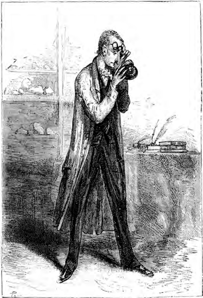
Otto Lidenbrock war ein großer, magerer Mann mit eiserner Gesundheit