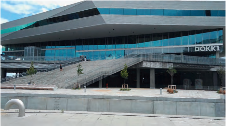
Abbildung 4 Dokk1 Aarhus