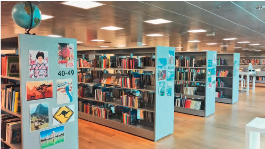
Abbildung 8 Visuelle Beschriftung – Stadtbibliothek Kolding