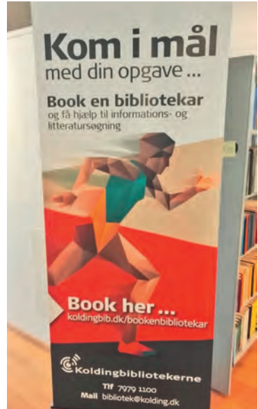
Abbildung 7 Bibliotheksservice buchen – Bibliothek in Kolding