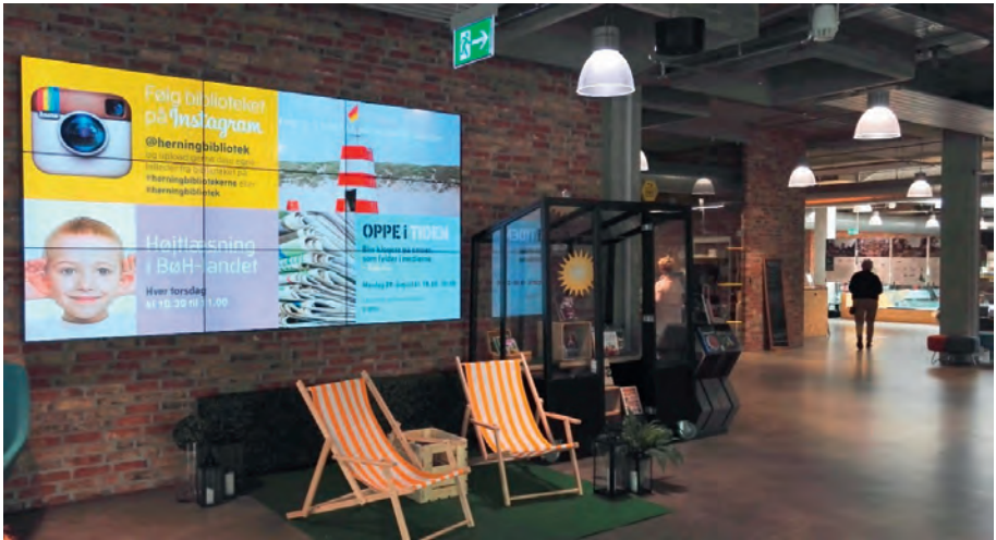
Abbildung 2 Infoscreen mit regionalen Angeboten - Bibliothek Herning