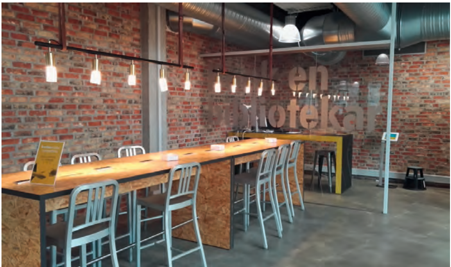
Abbildung 3 Arbeitsplätze in der Bibliothek Herning