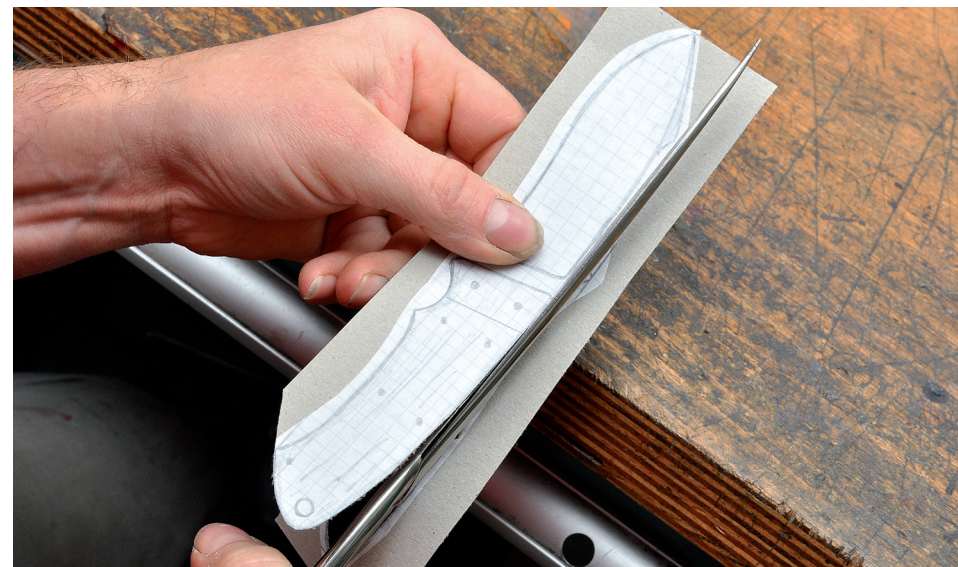
Wir schneiden eine Arbeitsschablone aus stabiler Pappe. Damit probieren wir aus, wie unser Messer in der Hand liegt.

Das, was uns auf dem Papier gefällt, soll ja später auch gut in der Hand liegen. Deshalb schneiden wir die Kontur aus und basteln uns eine Pappschablone. Es kann nicht schaden, mit dem „Messer“ eine Weile zu spielen. Man merkt dann schon, wo es passt oder zwickt und kann den Entwurf entsprechend nachbearbeiten.