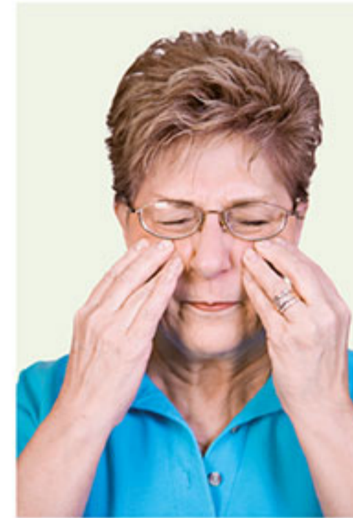
Nasennebenhöhlenentzündungen gehören in ärztliche Behandlung. Doch ein wohltuender Tee aus Bockshornkleesamen kann die Therapie begleiten.

Die Samen des Bockshornklees können innerlich und äußerlich verwendet werden. Innerlich