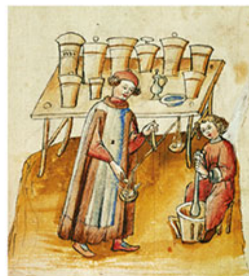
Ein Apotheker und sein Gehilfe bedienen sich einer Waage und eines Mörsers bei der Herstellung von Arzneien.

Wasser durch ein Tuch, und dann gib diesem Wasser Honig bei und etwas Essig und Süßholz und weniger Ingwer als Süßholz. Und so koche es nochmals, und fülle es dann in ein Säcklein und mache einen Klartrank, und trinke davon oft nach dem Essen und nüchtern, und es mildert und mindert den Schmerz in der Brust oder in der Lunge und Leber.“