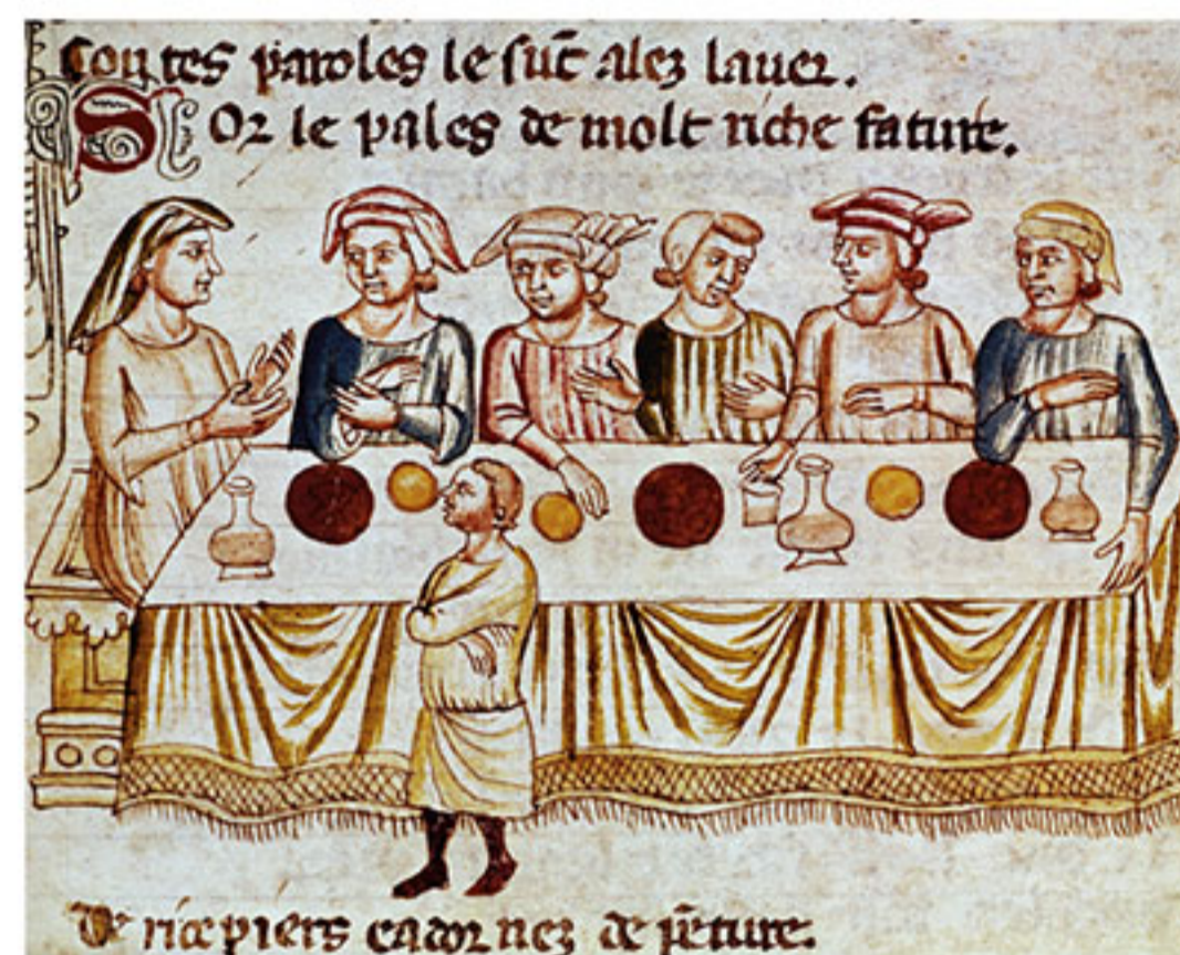
Eine fürstliche Familie sitzt bei Brot, Wein und Obst zusammen. Illumination aus dem altfranzösisch-italienischen Epos „L'Entrée d'Espagne“ (Der Weg nach Spanien).

Im Mittelalter gab es auch im Moselgebiet große Dinkelfelder. Dort wird Hildegard ihn kennengelernt haben. Sie schätzte ihn sehr: „Der Dinkel ist das beste Getreide.“ Tatsächlich verfügt Dinkelmehl über reichlich Kohlenhydrate, Mineralstoffe und etwa 2,7 Prozent Fett. Vor allem aber enthält es mindestens so viel Eiweiß (Kleber) wie andere Getreidearten, meist sogar deutlich