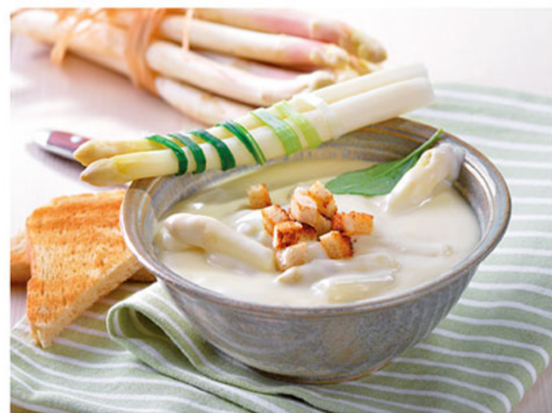
Wer eine Magenverstimmung oder einen Reizmagen hat, sollte sich auf Schonkost beschränken: wenig Fett, kaum Gewürze. Eine Spargelcremesuppe mit einer Scheibe Toastbrot ist sicher ein Gericht, das auch der empfindliche Magen vertragen kann.

Magenkrankheiten sind quälend. Häufig zum Beispiel ist ein nervöser Magen, auch Reizmagen genannt. Er äußert sich in gelegentlich oder häufig auftretenden Beschwerden wie etwa Übelkeit, Erbrechen, häufiges Aufstoßen, Sodbrennen, Druckgefühl, Blähungen, Appetitlosigkeit, Völlegefühl und sogar Mundtrockenheit. Meist fühlt man sich dann auch insgesamt unwohl, spürt oft sogar Angst, Herzbeschwerden oder kann nicht gut schlafen. Die Ursachen sind meist