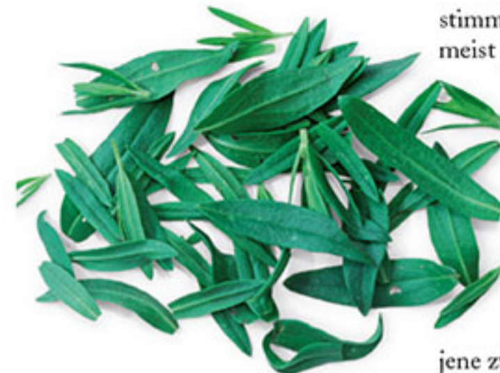
Der Ysop ist ein Heilkraut, das Hildegard gegen Magenprobleme eingesetzt hat. Er solle in Wein eingelegt und dann gegessen werden (siehe auch S. 306).

„Wer aber einen kalten Magen hat, der koche Hanf in Wasser und nach dem Ausdrücken des Wassers wickle er es in ein Tüchlein. Und er lege es warm oft auf den Magen und das stärkt ihn und bringt ihn wieder in seinen Zustand.“