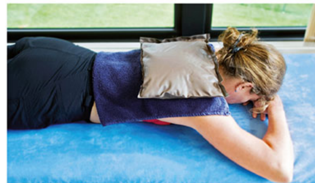
Eine Wärmeanwendung ist bei Rückenschmerzen immer gut. Hier liegt eine Fangopackung auf dem Schultergürtel, in dem Muskelverspannungen aufgetreten sind.

Schmerzen im Rücken sind heute eine Volkskrankheit, deren Ursachen oft unklar sind. Auch zu Hildegards Zeiten kannte man das Leiden, und die Äbtissin hat verschiedene Rezepturen, die Linderung bringen könnten.