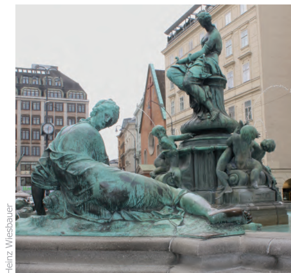
Die ursprünglichen Brunnenfiguren aus einer Blei-Zinn-Legierung wurden 1873 durch Bronzeabgüsse ersetzt. Die Originalplastik befindet sich heute im Belvedere.